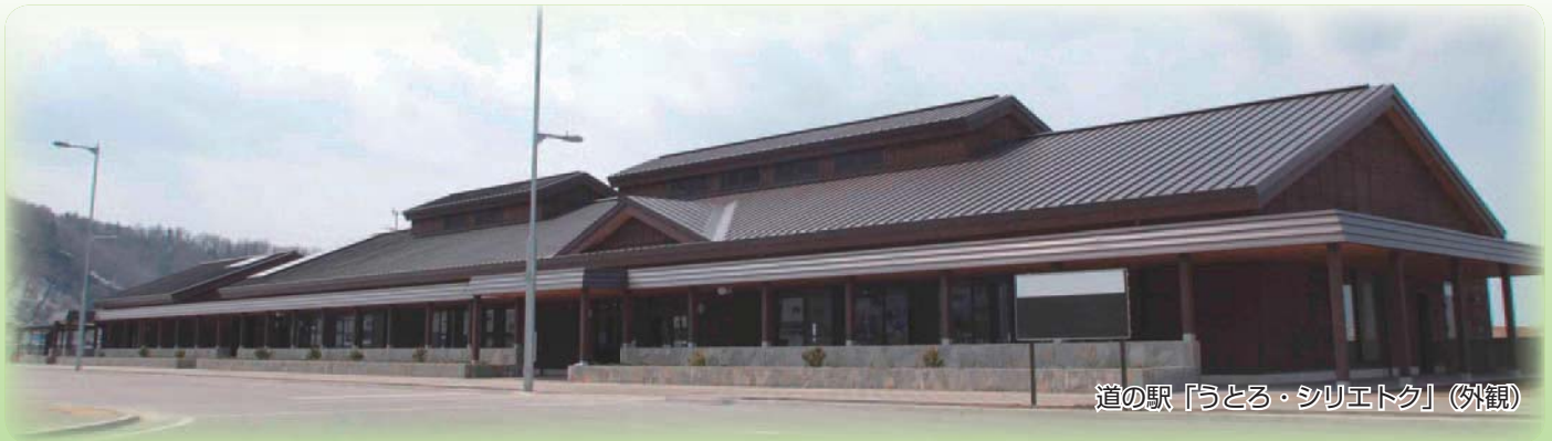
道の駅「うとろ・シリエトク」(外観)