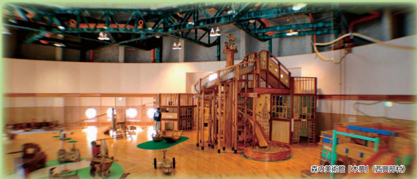
森の美術館「木夢」（西興部町）

オホーツクには、「木育」に取り組んでいる様々な施設・団体があり、それぞれに独自の活動を行っています。