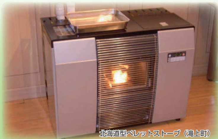
北海道型ペレットストーブ（滝上町）