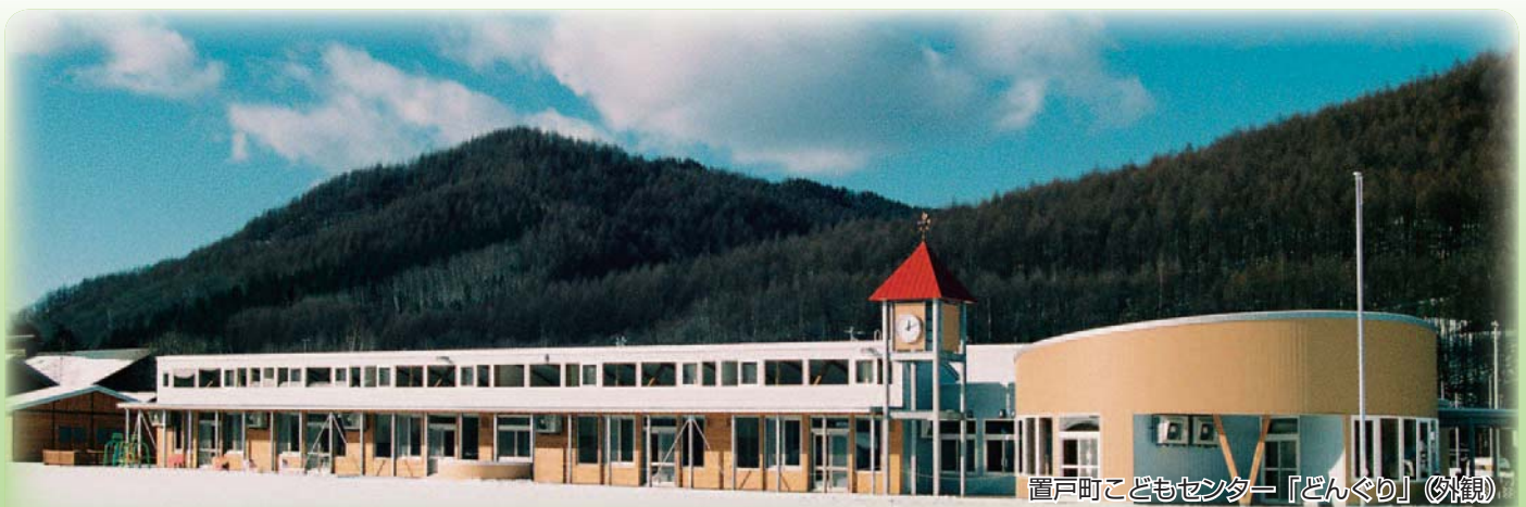
置戸町こどもセンター「どんぐり」(外観)