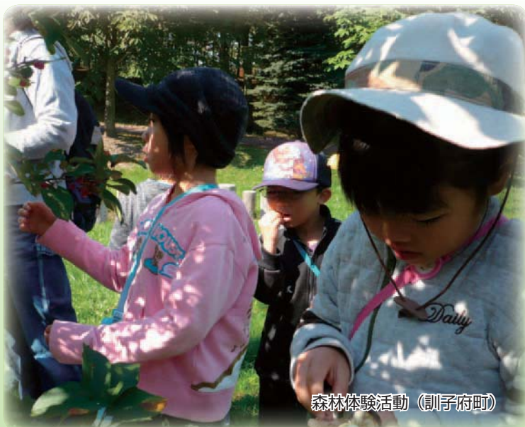
森林体験活動（訓子府町）