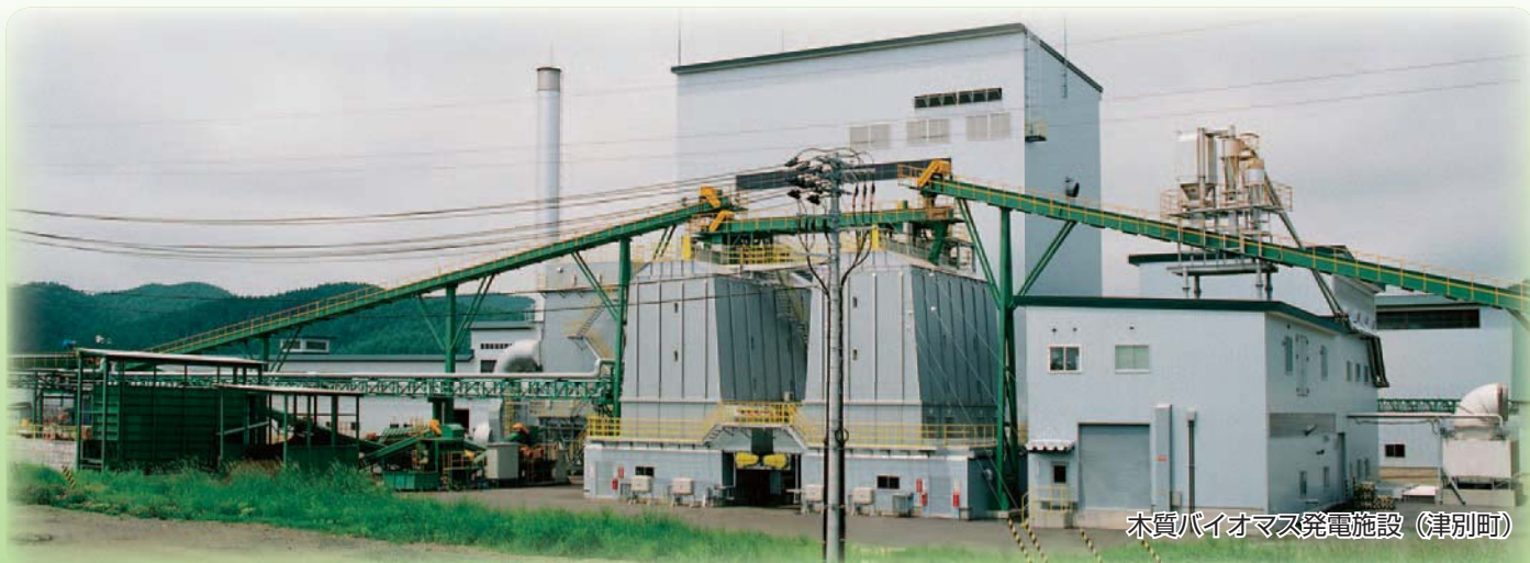
木質バイオマス発電施設（津別町）