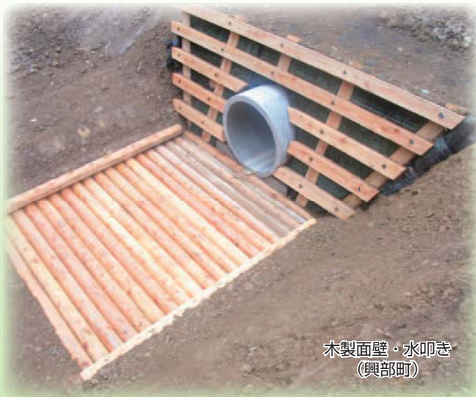
木製面壁・水叩き (興部町)