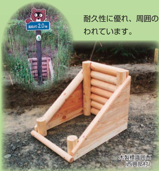
木製標識囲い (西興部村)