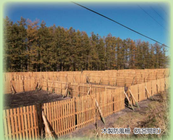
木製防風柵(佐呂間町)