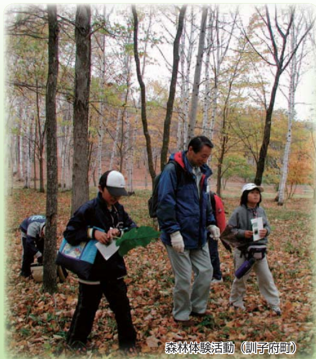
森林体験活動（訓子府町）