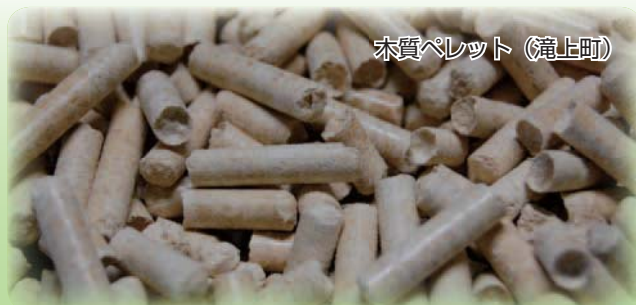
木質ペレット（滝上町）