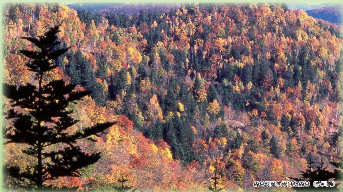
森林認証を受けた森林（紋別市）

今後も認証森林や認証事業体がさらに増えることにより、適切な森林管理と一体となった木材の有効利用が進められることが期待されています。